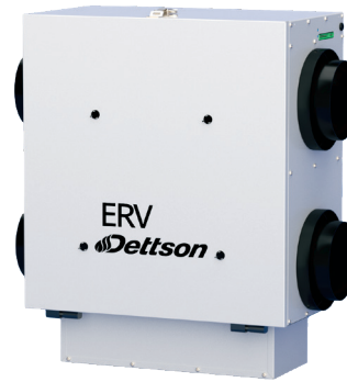
Modèle avec sorties latérales (Side Port)