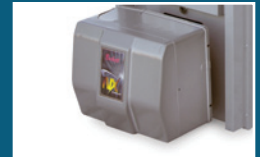
Brûleur Beckett NX