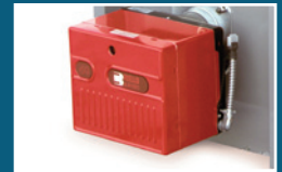
Brûleur Riello F-40