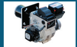
Brûleur Beckett AFG